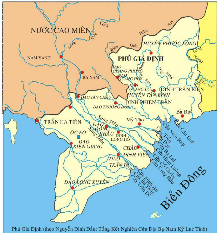
Phủ Gia Định (theo Nguyễn Đình Đầu: Tổng Kết Nghiên Cứu Địa Bạ Nam Kỳ Lục Tỉnh)

* 1929: Cap Saint-Jacques trở thành một tỉnh.