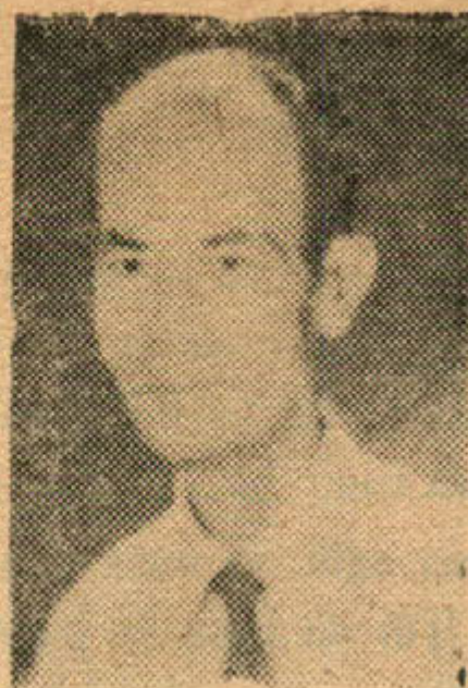
Ngày ra Thất 13-4-65

Cứ như thế tiếp tục, cần đi nhiều ít là tùy thuộc bệnh nặng nhẹ của hành