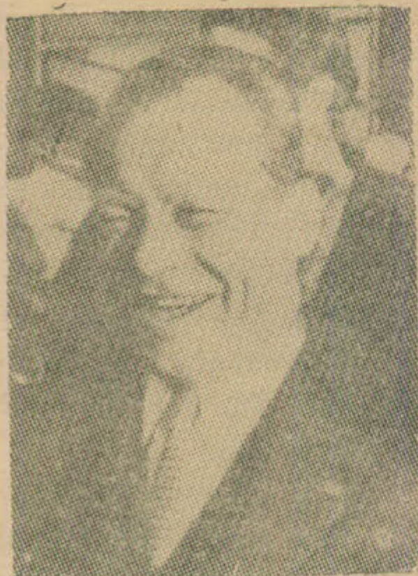
Tân Thủ - tướng Willy Brandt

hoạt động về vấn đề đối nội như tìm cách giảm bớt những bất công xã-hội, nâng cao mức sống của thợ thuyền (hiện nay còn tới 40% thợ thuyền, lợi tức dưới 150 đô-la 1 tháng) cải thiện giáo dục (chú trọng đến giáo - dục sinh-lý) y-tế xã-hội, tăng cường kỷ luật, trật tự, và chống nạn lạm phát