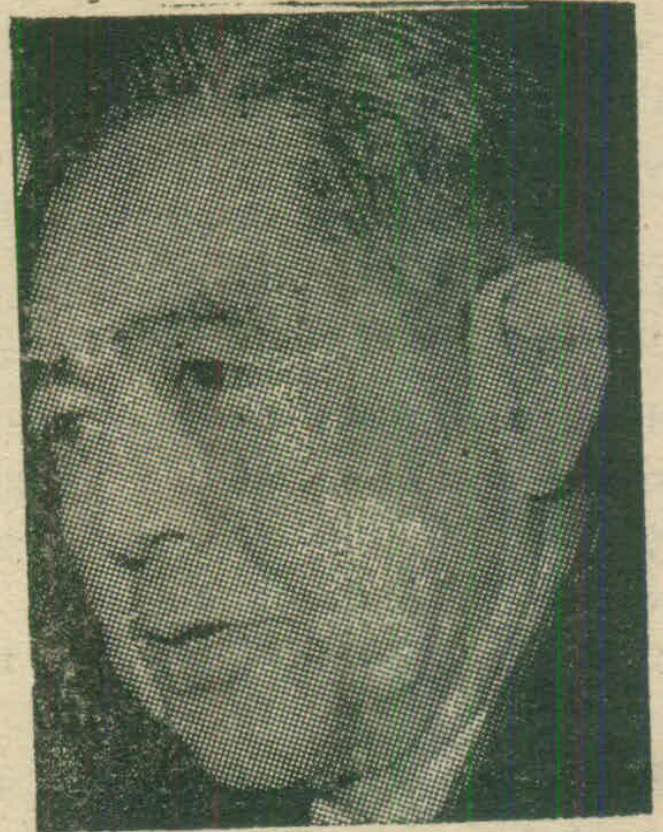
Eisaku SATO, Thủ tướng Nhật bản Chủ tịch Đảng Dân-chủ Tự-do

Năm 1931, các vụ lộn-xộn tại Mãn-Châu khiến Nhật viện cớ can thiệp bằng võ lực. Năm 1932, Mãn-châu-quốc được tuyên-bố là một quốc-gia độc-lập,