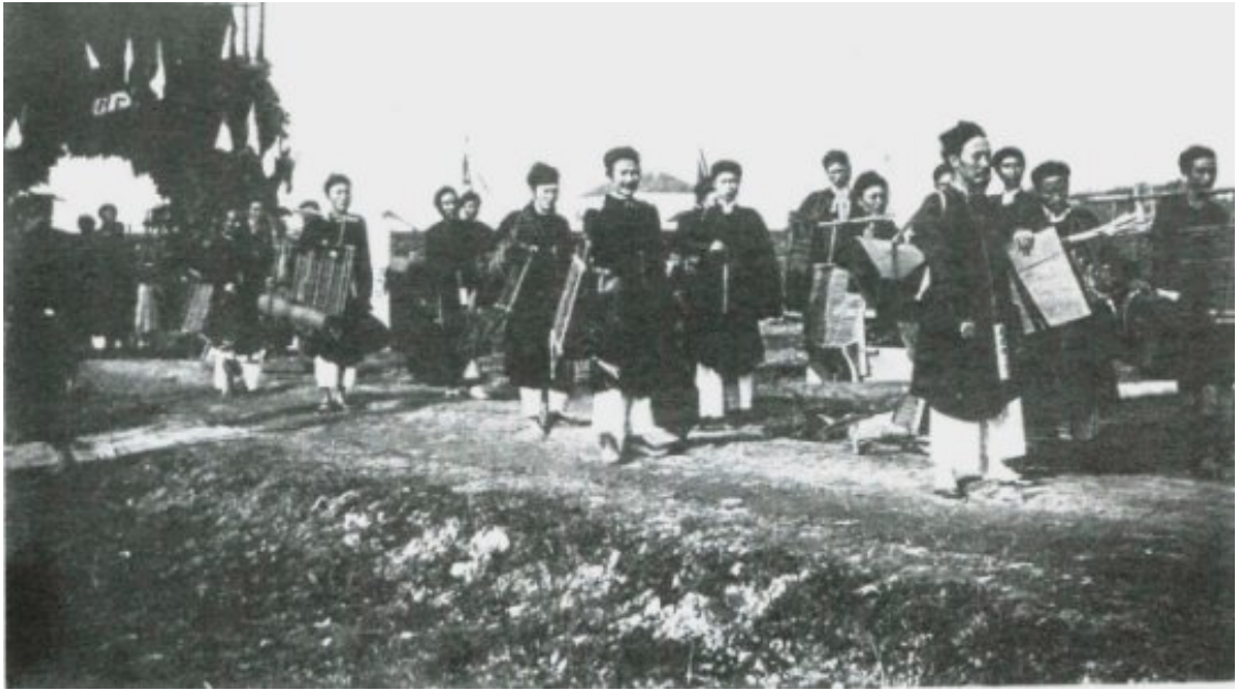
Lều chõng di thi Hương