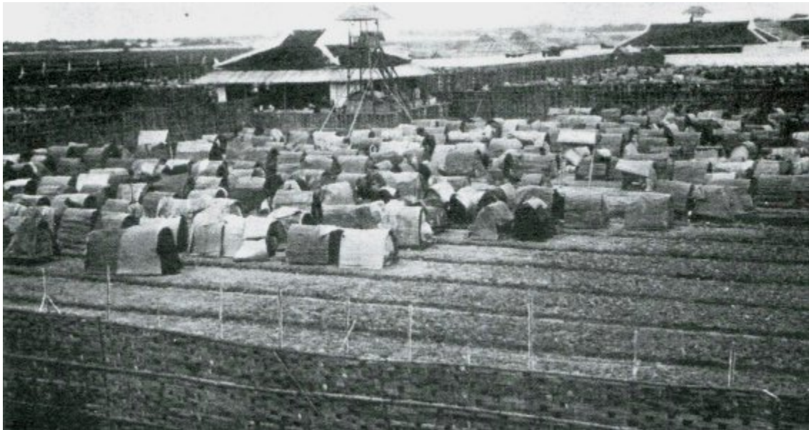
Trả nợ bút nghiên