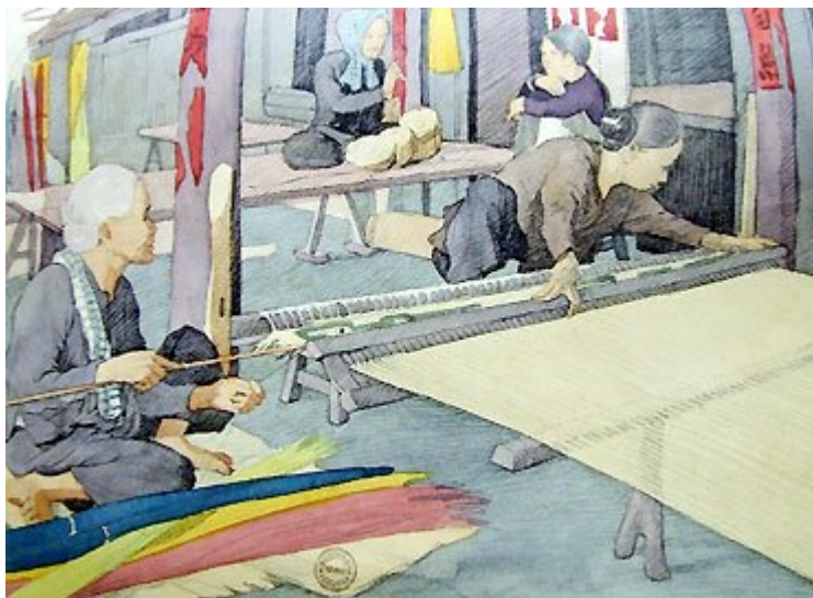
Cảnh dệt chiếu.