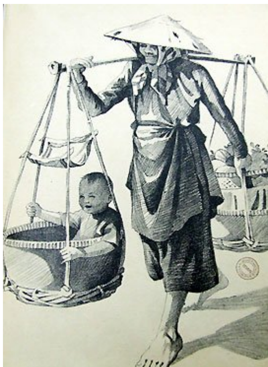
Bà gánh cháu.