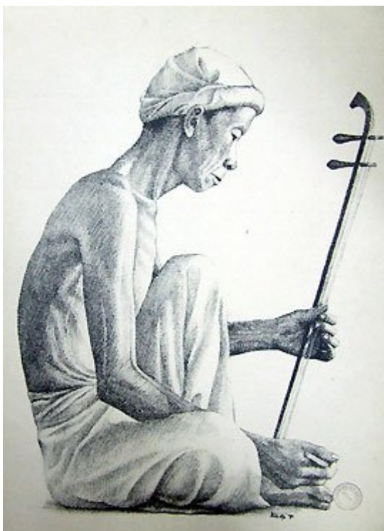
Một người chơi đàn cò.