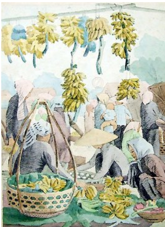
Một cảnh ở chợ chuối.