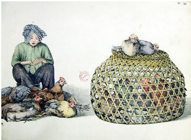
Người bán gà.