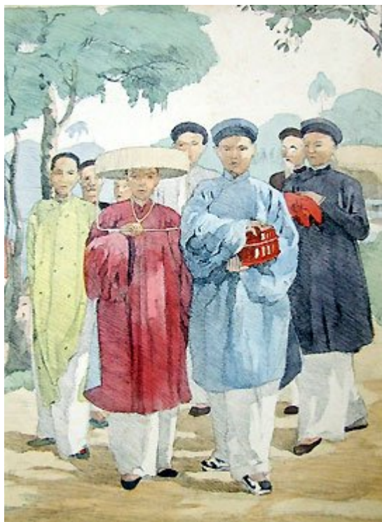
Đám cưới người Việt Nam xưa.