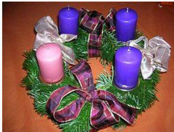
Vòng lá mùa Vọng

Vòng lá mùa Vọng là vòng tròn kết bằng cành lá xanh thường được đặt trên bàn hay treo lên cao để mọi người trông thấy, trong 4 tuần Mùa Vọng. Cây xanh thường được trang hoàng trong các bữa tiệc của dịp Đông chí - dấu hiệu của mùa đông sắp kết thúc. Trên vòng lá đặt 4 cây nến. Tục lệ này khởi xướng bởi các tín hữu Lutheran ở Đức vào năm 1839 với 24 cây nến gồm 20 nến đỏ và 4 nến trắng, cứ mỗi ngày gần Giáng sinh được đốt thêm một cây nến.