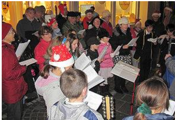
Hát mừng Giáng sinh ở Jersey