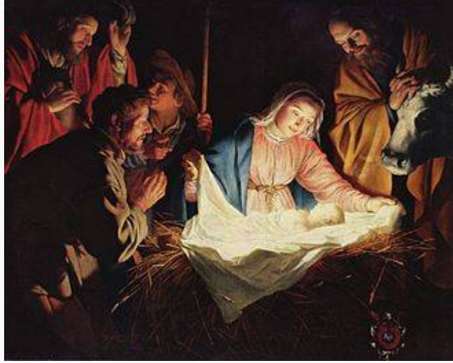
Các mục đồng chiêm bái, Gerard van Honthorst, 1622