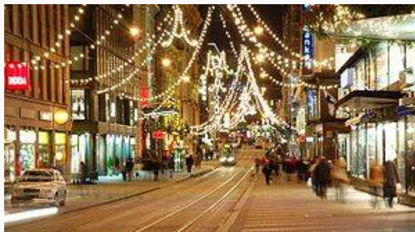
Phố xá ở Helsinki, Phần Lan, Lễ Giáng Sinh 2005