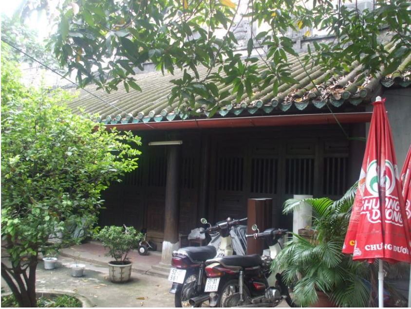
Nhà riêng Petrus Ký hiện nay

nghi hưu non, sống ẩn dật tại nhà riêng ở Chợ Quán (nay nằm tại góc đường Trần Hưng Đạo và Trần Bình Trọng, quận 5).