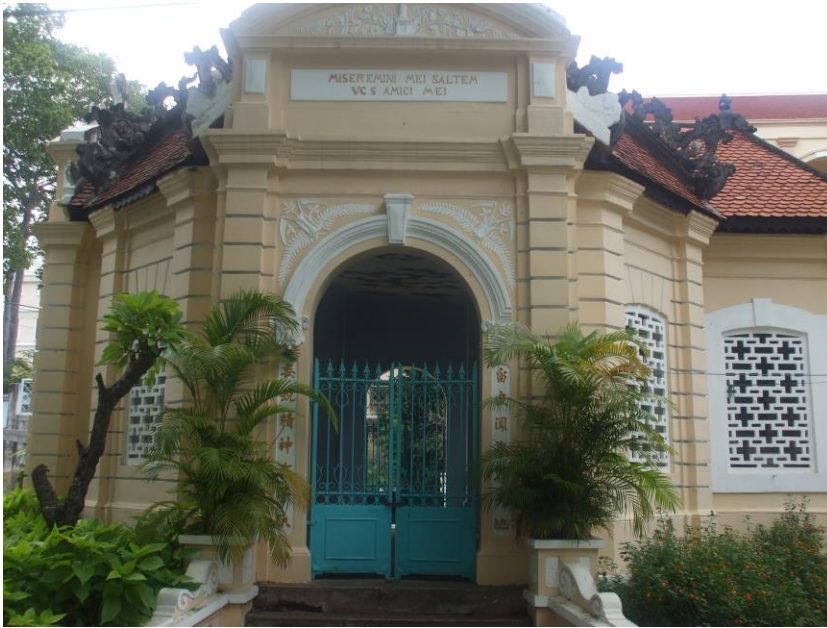
Nhà thờ Petrus Ký với câu La Tinh phía trên cửa