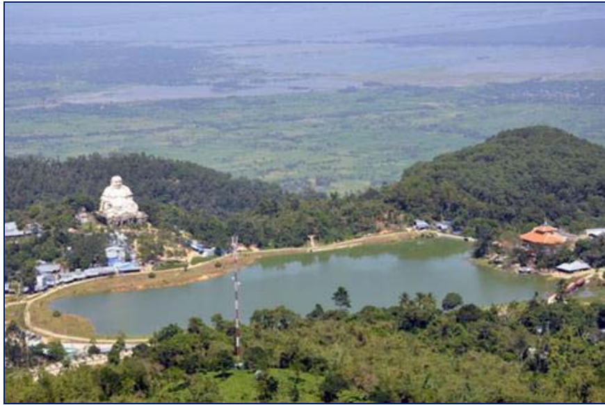
Nhìn từ núi Ông Cẩm

Thất Sơn, cái tên rất quen mà rất lạ. Quen bởi bất cứ ai sống ở Nam bộ đều biết đó là bảy ngọn núi huyền thoại ở tỉnh An Giang. Lạ vì mấy ai đã thật sự đặt chân tới ngàn ấy đỉnh núi.