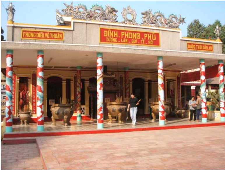
Tiền Điện – Đình Phong Phú (hình trên)