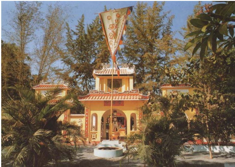
Tam Quan – Đình Phong Phú (hình dưới)